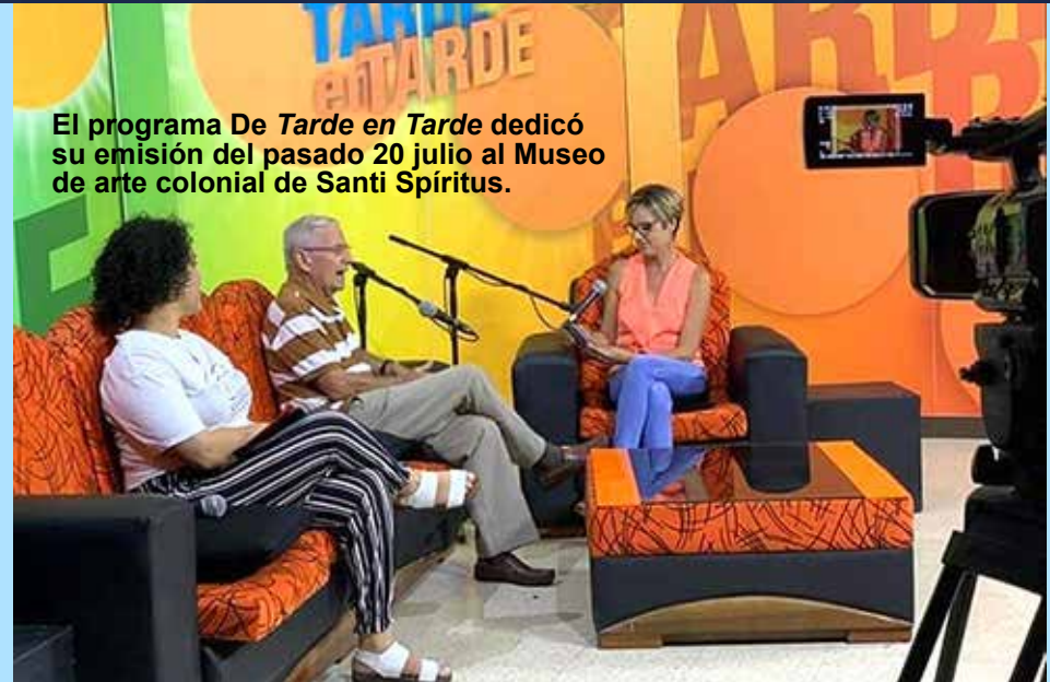
El programa De Tarde en Tarde dedicó su emisión del pasado 20 julio al Museo de arte colonial de Santi Spiritus.

Uno de los retos actuales de la TV territorial focaliza la ampliación de los servicios de traducción, así trascendió durante la reunión de la Comisión Provincial para la Atención y los Servicios a las personas en situación de discapacidad, celebrada el 29 junio.