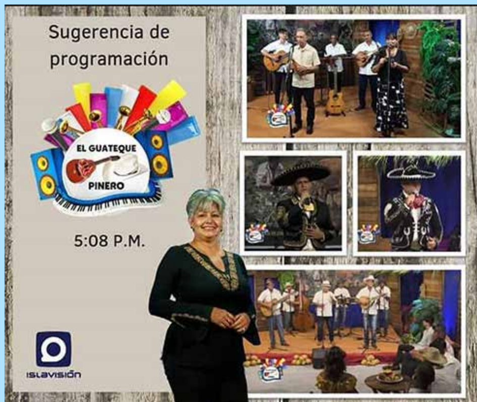
Espacio de estreno en la programación de verano que transmite Islavisión.

Para capacitarse y lograr un mejor desempeño, directivos, productores, asesores y directores de programas del telecentro participaron, en abril, en el curso "Apreciación de las artes visuales", impartido en el Centro Provincial de Superación para la Cultura de Sancti Spíritus.