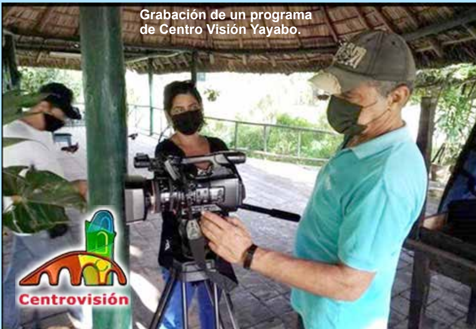
Grabación de un programa de Centro Visión Yayabo.