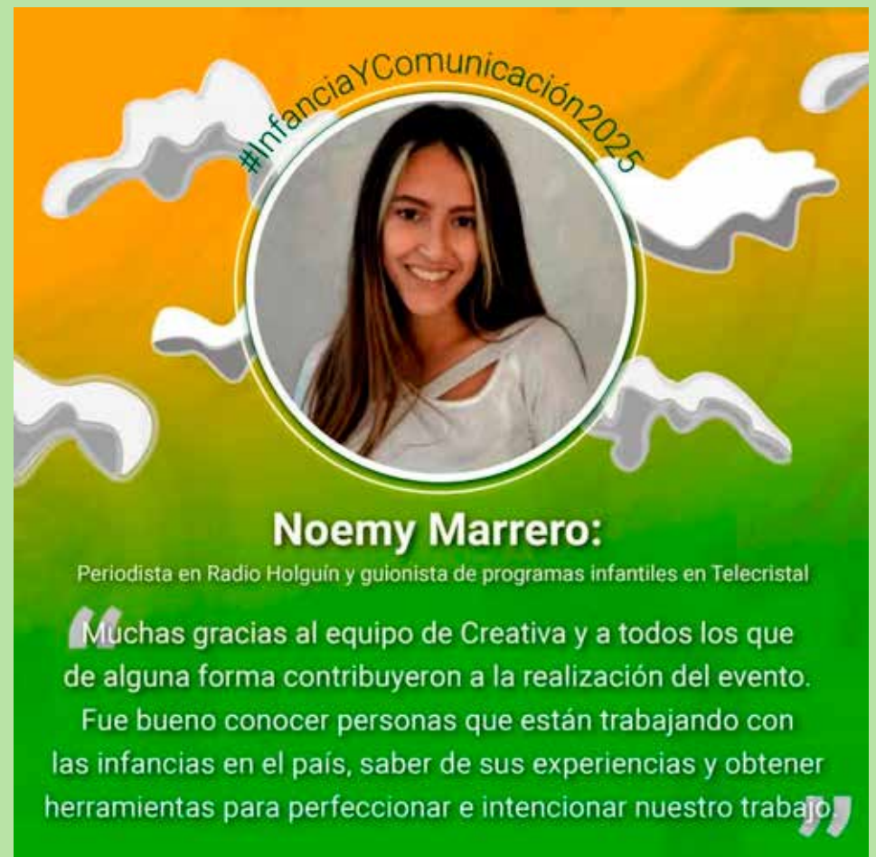
Reflexiones de algunos de los participantes del evento

–Si hablamos de aprendizajes, tendría que profundizar en varios aspectos. Pero creo que lo fundamental es que, al convocar a las personas para discutir temas realmente sensibles, que impactan el quehacer comunicacional en todas las esferas de la sociedad, hemos observado una participación entusiasta y comprometida en el desarrollo de la niñez y la